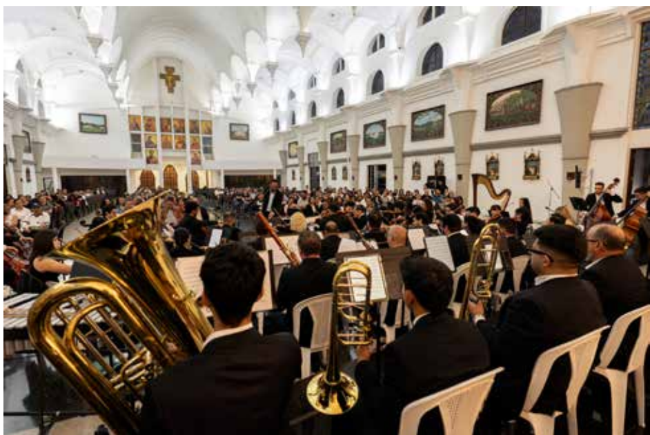
Concierto en el Templo Parroquial de Nuestra Señora de Ujarrás.