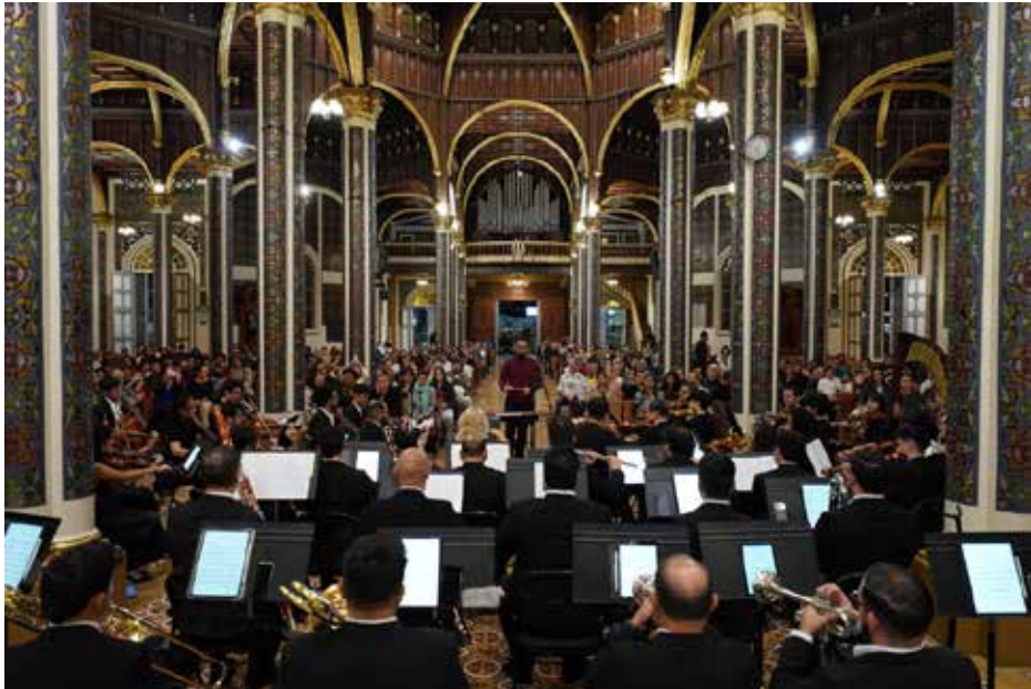
Concierto en la Basílica de Nuestra Señora d los Ángeles, junio 2026

como un pulso o polirritmia obsesiva y minimalista ejecutada con los bronces, maderas y vientos del registro agudo como el “piccolo” (o flautín), representando aquella señal ultra-sónica intermitente que se abre paso en la gran masa sonora orquestal. Además, por supuesto de efectos “glissandi” ascendentes o descendentes como emulación acústica de los “gemidos” entre las aguas que regeneran la espacialidad sónica al canto de los cetáceos del océano.